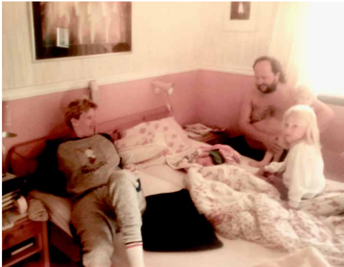
Ambulansesjåføren tok dette bildet av den nybakte trebarnsfamilien like før mor og barn blei kjørt til Stavanger i ambulanse.