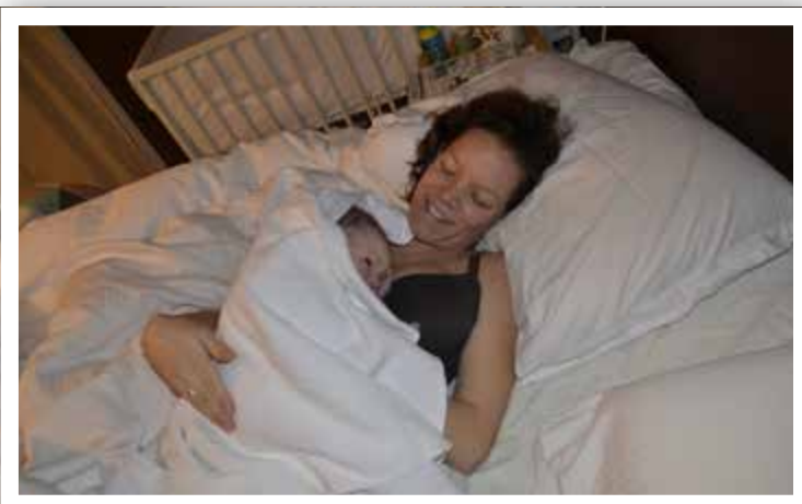
Mor og barn fotograferte heime i senga på Fister like etter fødselen.

Fisterkvinna skryt av jordmødrene ho har hatt under svangerskapa sine. To gonger har ho opp- levd at jordmødrer har vore med henne til byen utan at dei har hatt vakt.